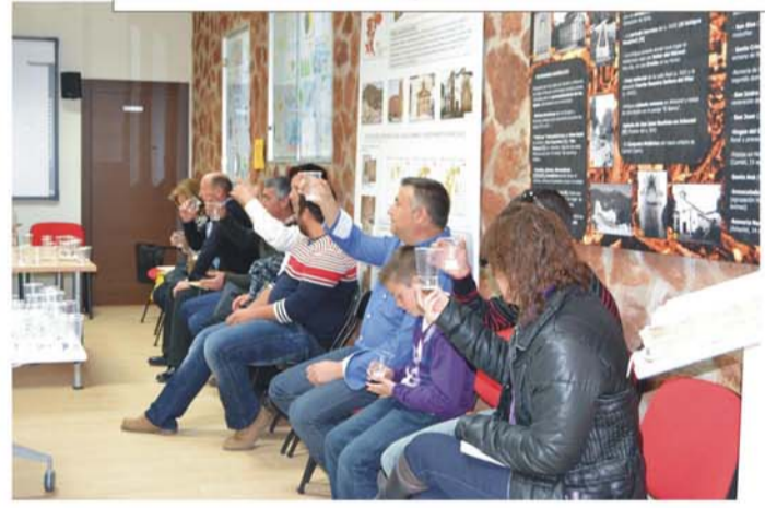
Nombre: "CATA DE AGUAS" Actividad: cata didáctica Objetivo: identificar y explicar las diferencias detectadas en cada una de las aguas degustadas