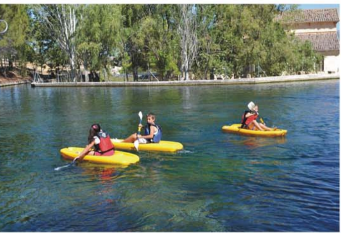
Nombre: "JORNADAS DEL AGUA EN EL NAC. DE ARBUNIEL" Actividad: introducción al piragüismo Objetivo: relacionar a los niños y niñas con la conservación del buen estado de las masas de agua en su vertiente lúdica