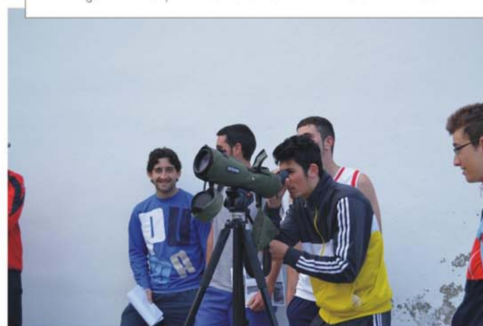
Nombre: "CURSO DE EDUCACIÓN AMBIENTAL" Actividad: curso de formación a través del IAJ Objetivo: formar y fomentar la figura del monitor ambiental como nicho de empleo