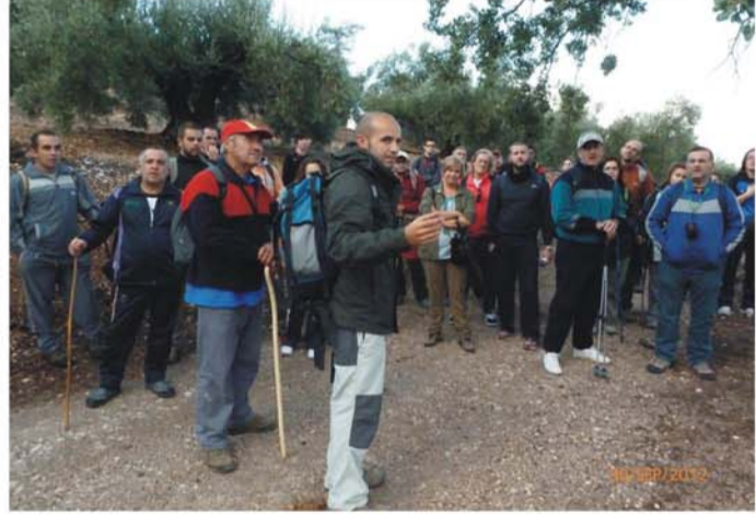
Nombre: "CAMINATA POR LOS BUITRES PN SIERRA MÁGINA" Actividad: senderismo y ornitología Objetivo: concienciar a la población local sobre el papel de las aves necrófagas y sus problemas de conservación