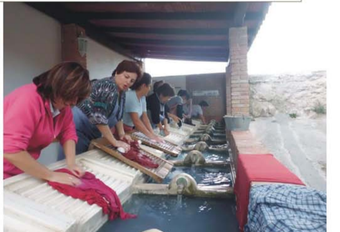
Nombre: "Jornadas socioculturales sobre la MUJER RURAL" Actividad: taller etnográfico sobre la mujer rural y los lavaderos Objetivo: inventariar, recoger y ensalzar a través de la figura de la mujer rural el patrimonio sociocultural de los lavaderos