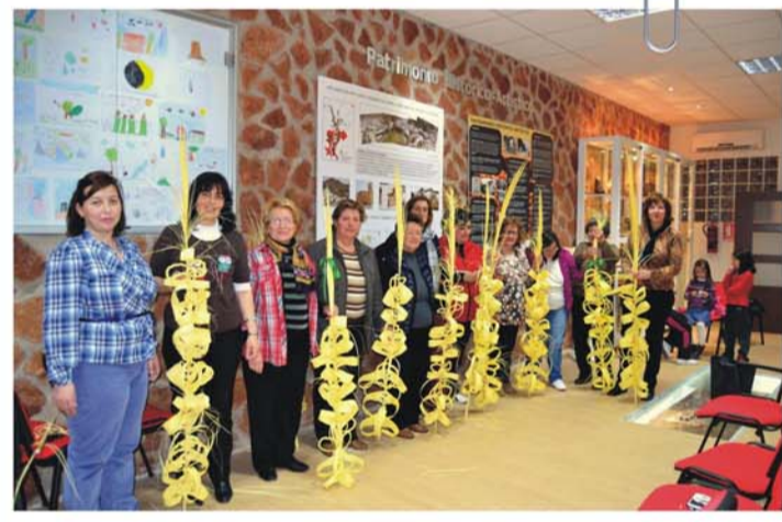
Nombre: "TALLER DE RIZAR PALMAS DE PASCUA" Actividad: taller de trabajos manuales Objetivo: involucrar a la mujer rural en el ámbito de las actividades de ocio y tiempo libre