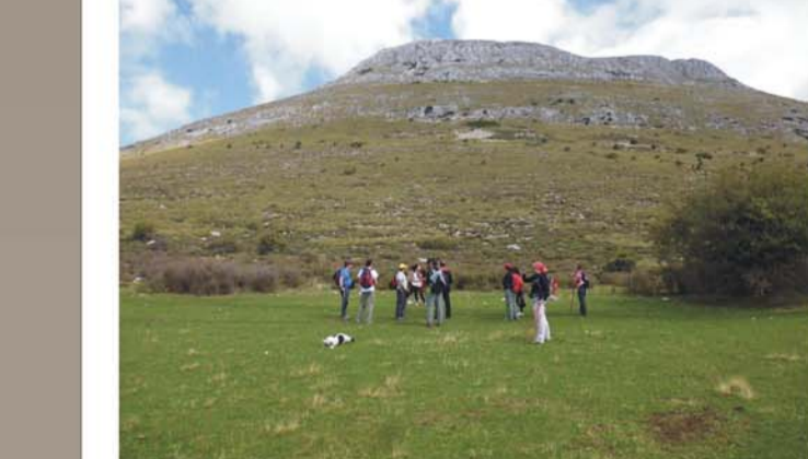
Nombre: "PASEO POR EL KARST DE MÁGINA" Actividad: ruta senderista Objetivo: conocer la belleza y fragilidad del karst