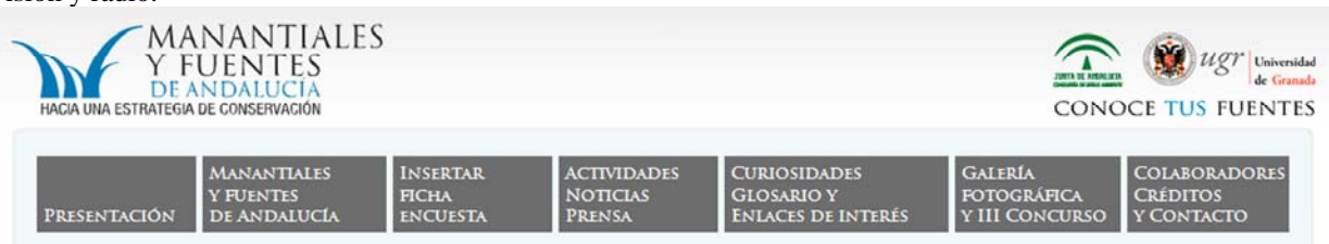
FIGURA 2. Botonería principal.

Pero los objetivos del Proyecto no están limitados a la elaboración del catálogo en sentido estricto, es decir, a dejar constancia documental y fotográfica, sino que se vienen realizando una serie de actividades de difusión del mismo para darlo a conocer, junto con actividades divulgativas, para contribuir a un mayor conocimiento de los manantiales y fuentes de Andalucía. Entre ellas se incluye la realización de exposiciones itinerantes del proyecto (42), concursos fotográficos (3), encuentros de colaboradores (2), participaciones en talleres, cursos, simposios y jornadas (31), así como la elaboración de material para libre distribución, entre el que se incluye un cuaderno divulgativo del proyecto (Castillo Martín, 2009), un video, trípticos, cartelería, etc. disponibles en www.conocetusfuentes.com , junto con el libro “Manantiales de Andalucía” (Castillo Martín, 2008). También se ha intervenido en numerosos programas de televisión y radio.