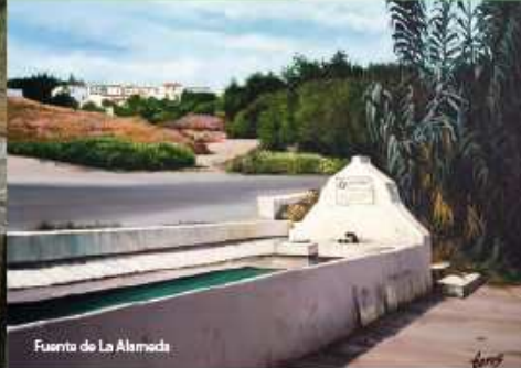
Fuente de La Alameda