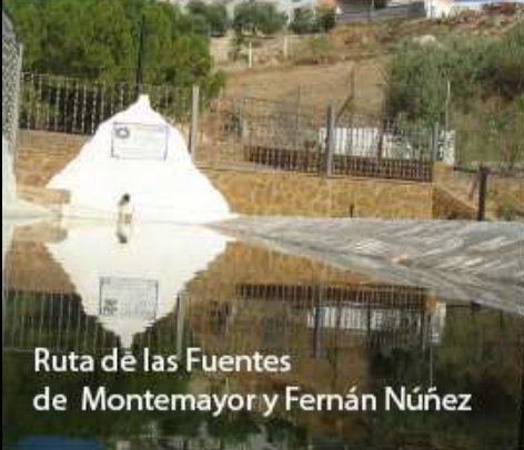
Ruta de las Fuentes de Montemayor y Fernán Núñez