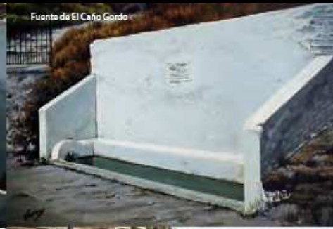
Fuente de El Caño Gordo

cárnicalos, mochuelos, perdices, jilgueros y cogujadas completan la biocenosis de este peculiar ecosistema, donde la vida puede ser menos evidente, pero no por ello menos valiosa.