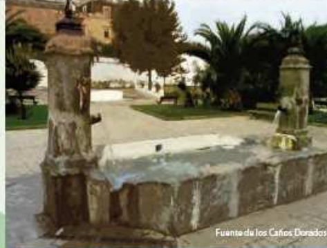
Fuente de los Caños Dorados

Entre estos asentamientos destaca, en el término de Fernán Núñez, Valdeconejos, de donde proceden, entre otros muchos restos, numerosos proyectiles de honda, lo que nos habla de enfrentamientos armados en la zona. Aquí se ha recuperado igualmente un mosaico que, aunque fragmentado, conserva representaciones como las de las cuatro estaciones o el rapto de Europa. Por su parte, dentro del municipio de Montemayor, hay que citar la Sargadilla, donde se halló un retrato masculino barbado y denominada "Venus de Montemayor", ambos fechados en el siglo II d. C. y labrados en mármol blanco.