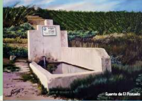
Fuente de El Pozuelo