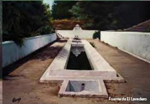
Fuente de El Lavadero