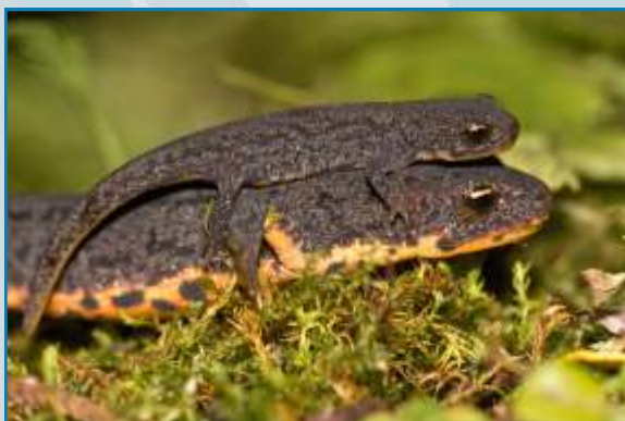
Tritón ibérico

El tritón ibérico es una especie de anfibio endémico de la Península ibérica incluido en el Libro Rojo de los Vertebrados Amenazados de Andalucía