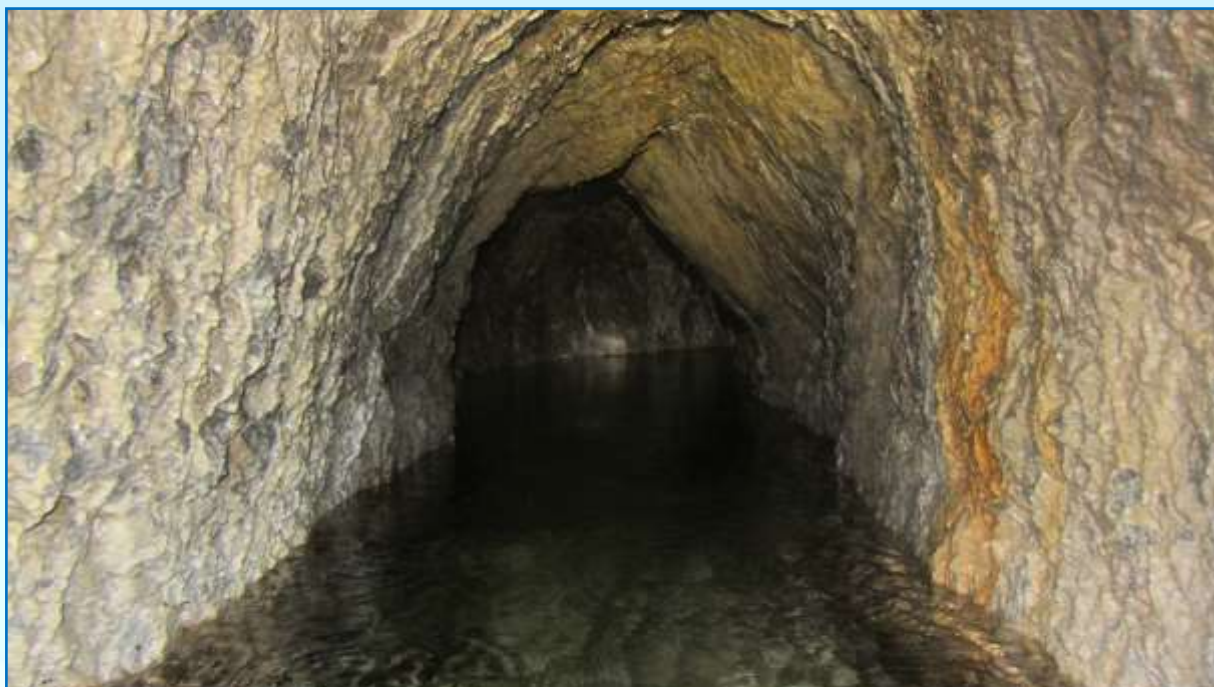
FOTO DEL MES: Mina del Lagar de Noriega (Málaga) Rafael Blanco Sepúlveda