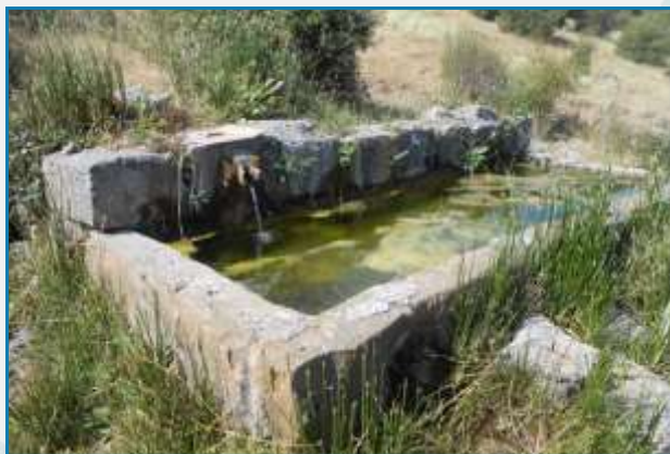
Pilar de la Montesina (Valdepeñas de Jaén, Jaén) J. Narváez Jiménez (agosto, 2018)

En la provincia de Málaga, el manantial de la Saladilla en Antequera y diversas minas y lagares como el de Don Benito, Lo Pinto, Venta de la Victoria, Arroyo Zapatero, Cuatro Cuartos, Santa Cruz, El Francés, Tintorero, Gálvez y Casilla de la Hoya.