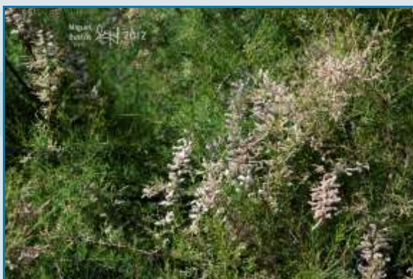
Sauco o saúco

Es un árbol o arbusto caducifolio de 4-6 m (raramente 10 m) de altura. Tronco con corteza suberosa. Presenta hojas pecioladas, dispuestas en pares opuestos. Las flores en grandes corimbos, flores individuales blancas, 5-6 mm de diámetro, con 5-pétalos dentados.