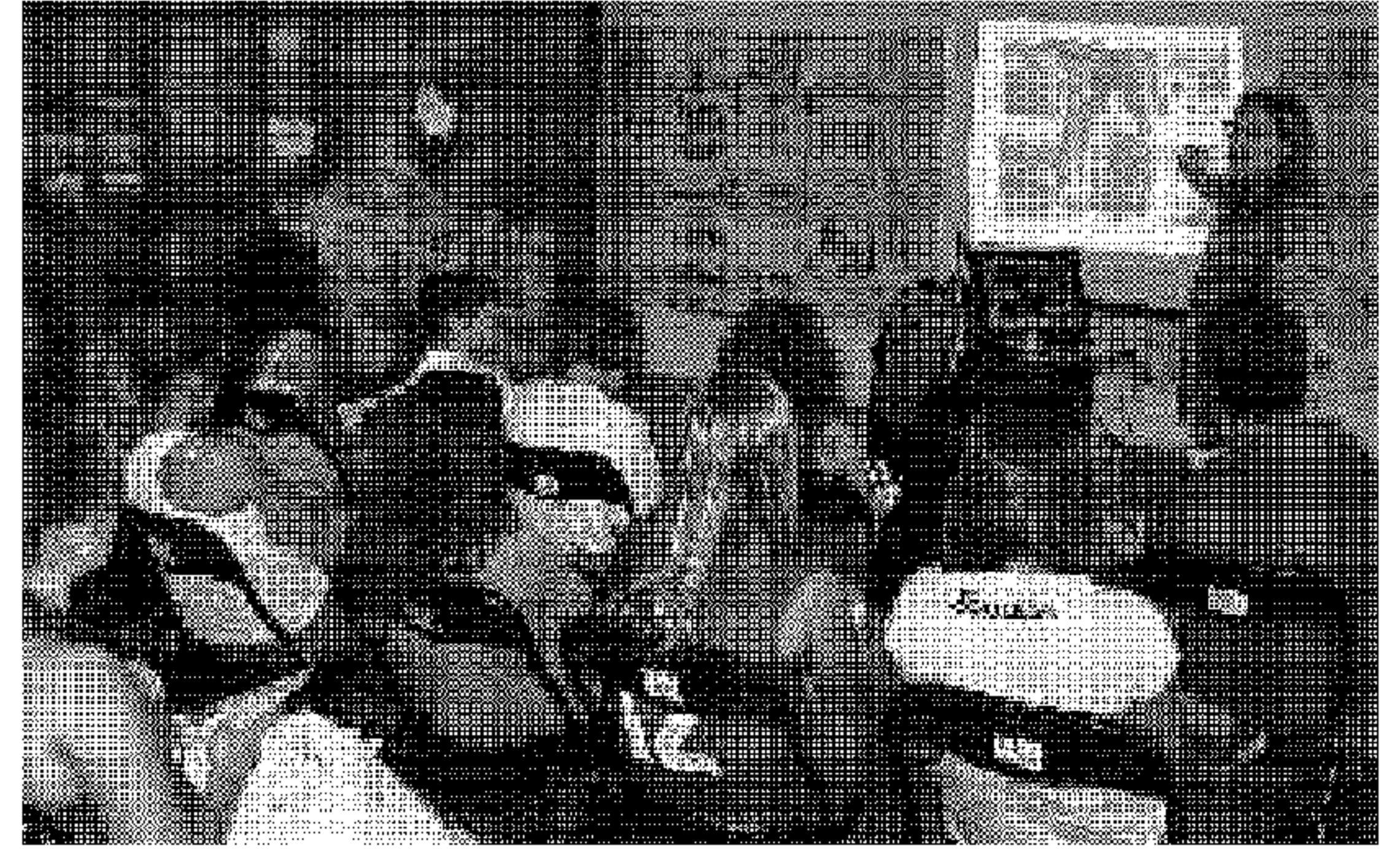
CONFERENCIA. Alumnos del IES El Chaparil, ayer en la charla.