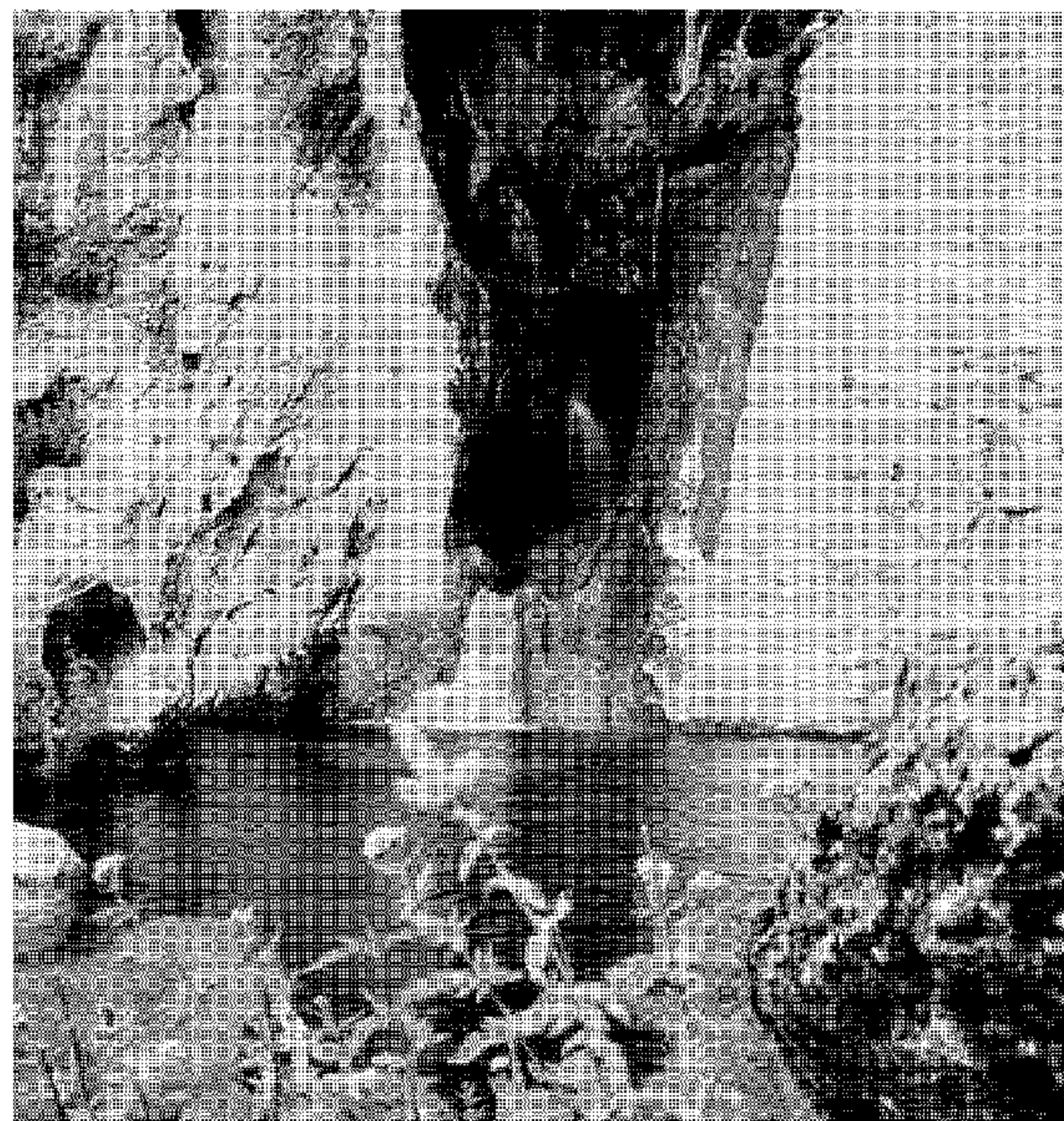
FUENTE. Nacimiento del río Borosa en Cazorla.

El inventario, pionero en su método de recopilación de datos, clasifica las fuentes y manantiales según sus niveles de conservación, calidad ambiental, importancia